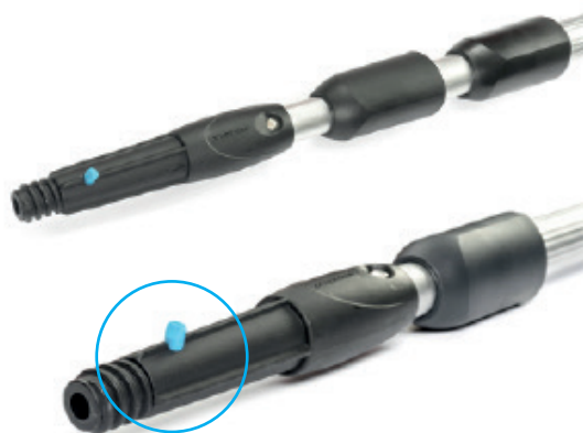
Sistema Clic EASE

APLICACIONES: Palos telescópicos Línea Moerman disponibles en 1,2 m, 3m, 5 m y 9 m.