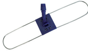
Ref. 03703 Ensamblaje Plegable 75 cm. (Ancho 12,5 cm.)