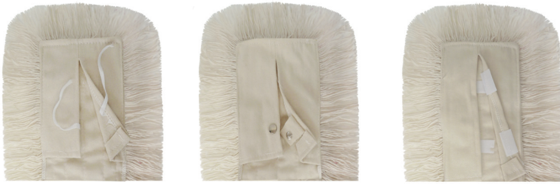
Disponible con cierre de cintas, clec o velcro.

“La información aparecida en esta Ficha Técnica se tiene como cierta y correcta. No obstante, la exactitud total de esta información así como cualquier sugerencia o recomendación se hace sin garantía. Dado que las condiciones de uso están más allá del control de nuestra empresa, es responsabilidad del usuario determinar las condiciones para un uso seguro de este producto.”