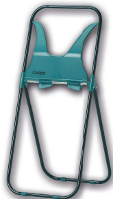
REF: CP-0524 Acabado GALVANIZADO Y LACADO EPOXY