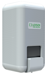
REF: CJ-3003-B Acabado BLANCO