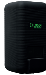
REF: CJ-3003-MT Acabado NEGRO MATE