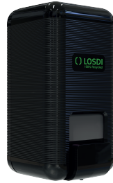
REF: CJ-3003-BL Acabado NEGRO