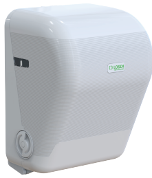
REF: CP-3525-B Acabado BLANCO