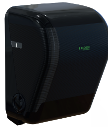
REF: CP-3525-BL Acabado NEGRO