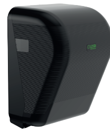
REF: CP-3525-MT Acabado NEGRO MATE